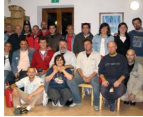
Cena di ringraziamento per i Pompieri che hanno salvato il rifugio dall'incendio del 6 gennaio 2004

e comodi. 2 servizi igienici con WC, lavabo, doccia e acqua calda. Un bagno è attrezzato per i diversamente abili. Ogni ospite dispone di un armadietto personale. Non vengono fornite lenzuola, mentre sono in dotazione coperte e cuscini.