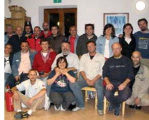
Cena di ringraziamento per i Pompieri che hanno salvato il rifugio dall'incendio del 6 gennaio 2004

e comodi. 2 servizi igienici con WC, lavabo, doccia e acqua calda. Un bagno è attrezzato per i diversamente abili. Ogni ospite dispone di un armadietto personale. Non vengono fornite lenzuola, mentre sono in dotazione coperte e cuscini.